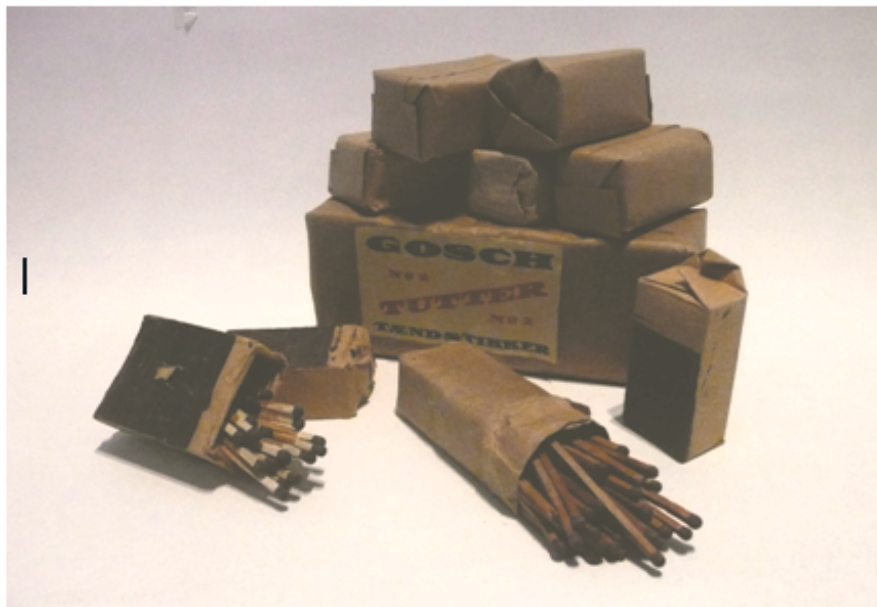
Tutteme på forskellige udviklingstri, uden og med strygeflade