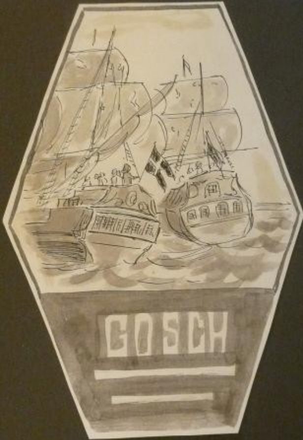
Tordenskjold i kamp med svenske skibe ved Dynekilen.

Skitser til Tordenskjoldserie samt slotsserien