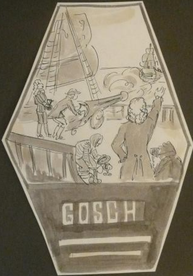
I en træfning med svenskerne slap ammunitionen op, og Tordenskjold lod da sit kostbare tinservice nugge i stykker for at bruge det som kugler. Ved denne træfning, fortælles det, var hans bjørn til stede på dækket.