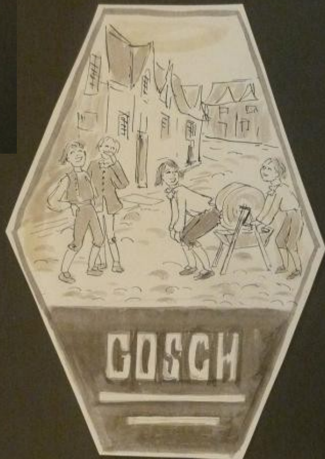
Brengen Feder Wessel blev udstyret med læderbenklæder, fordi han var så alen til at slide sit tøj, - men fandt straks på at sætte bagen mod en alibesten, så også disse solide klæder blev elidt itu.