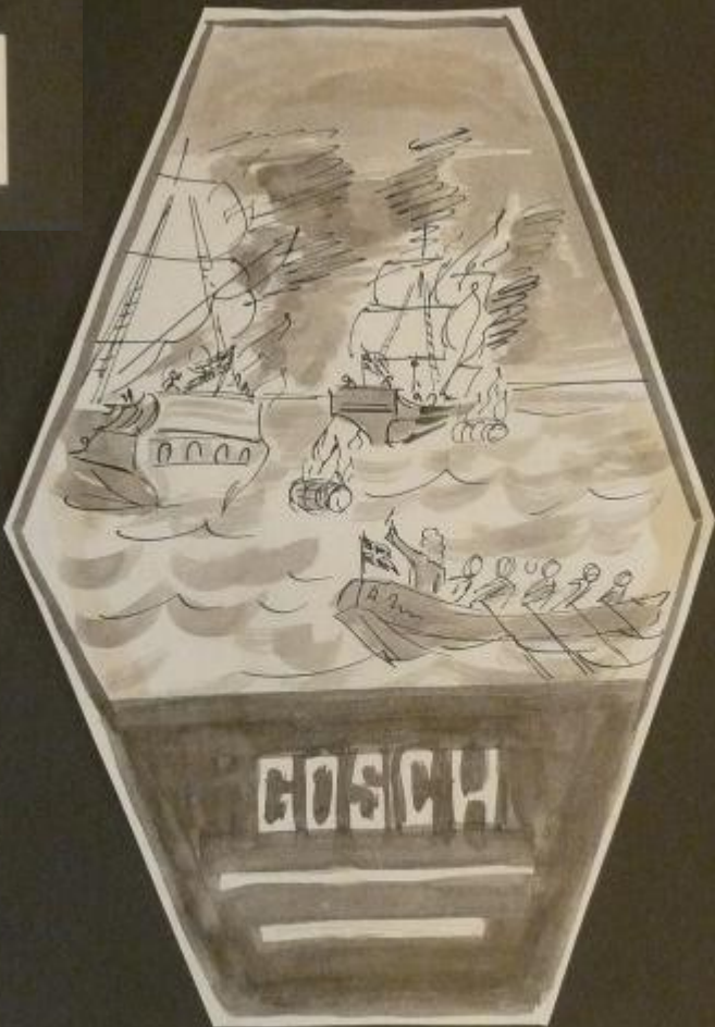
Tordenskjold sætter de svenske skibe i brand med brændende tåreretender og begrænse.