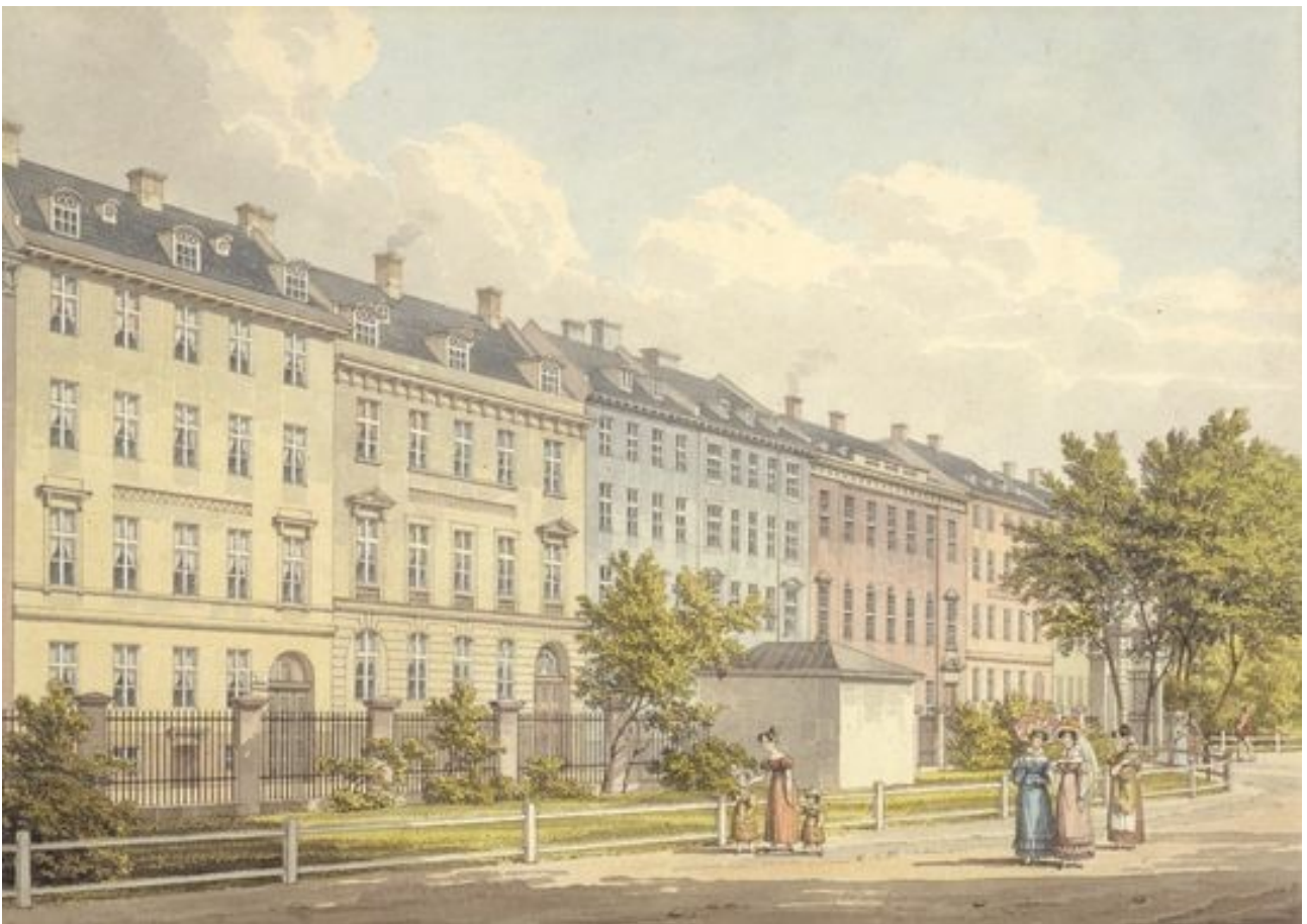
Bagsiden af en af de små butikker / pavilloner ud mod de mondæne husfacader i Kronprinsessegade. Man kan jo godt forstå brandvæsnets bekymring for at lugten fra fabrikken vil genere de promenerende.